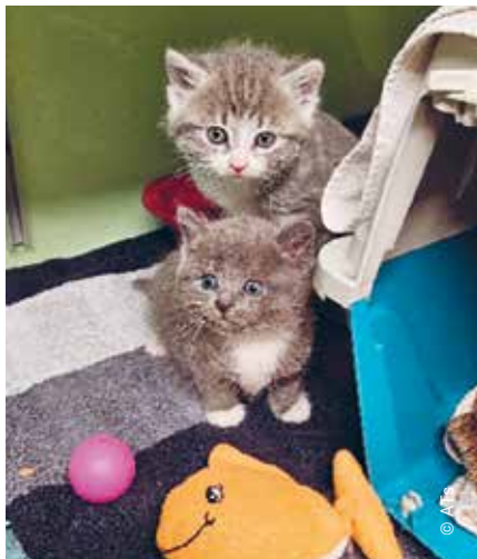
Ausgesetzt im Dorf